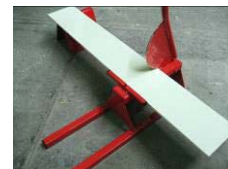
CEDRAL LAP schaar

Versnijden: CEDRAL LAP kan ook op lengte geknipt worden met de CEDRAL LAP knipschaar (beschikbaar bij Eternit)