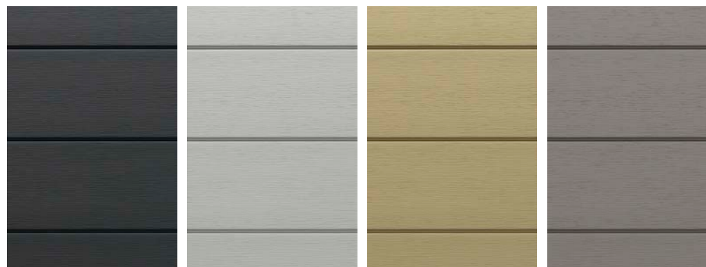
Rainure en U anthracite

Longueur d'une lame: 240 cm / Hauteur visible: 18,5 cm