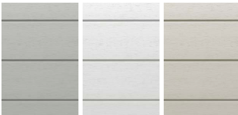
Rainure en U gris

Longueur d'une lame: 240 cm / Hauteur visible: 18,5 cm