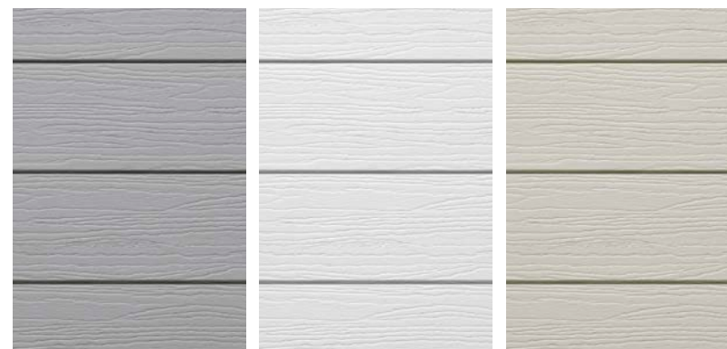
Lame superposée gris

Longueur d'une lame: 240 cm / Hauteur visible: 17 cm