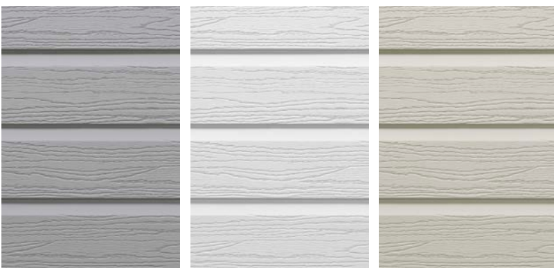
Lame superposée gris

Longueur d'une lame: 240 cm / Hauteur visible: 15 cm