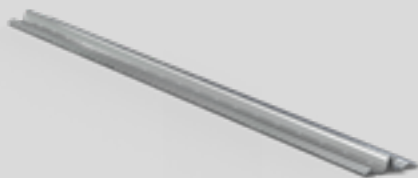
GUIDES DE PLAFONNAGE

Profilé en aluminium pour la réalisation aisée d'enduits au plâtre standards (par ex. Goldband, MP 75, ECOfin 2.0 ou DUO Light) lisses et d'aplomb.