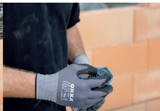
2. Retirez le clip de protection