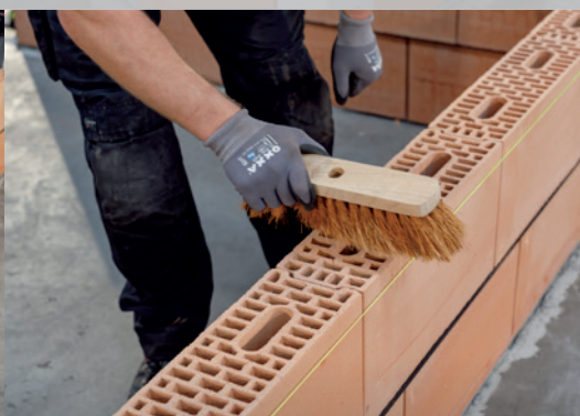
14. Brossez les blocs