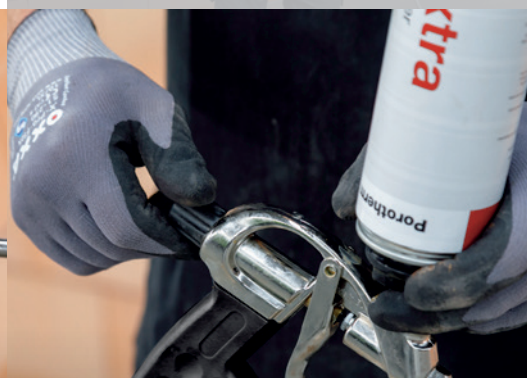
4. Réglez le débit au moyen de la vis