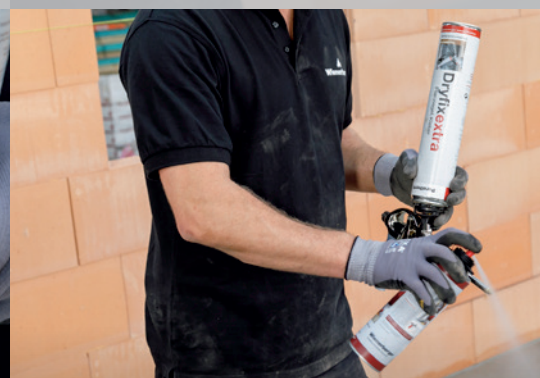
5. En cas de courtes pauses, nettoyez la tête de projection avec Dryfix cleaner