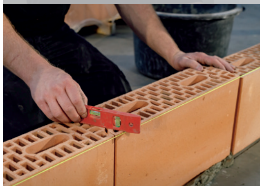
6. Contrôlez la planéité de l'assemblage à tenons et mortaises