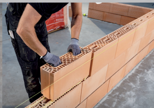
17. Posez les blocs