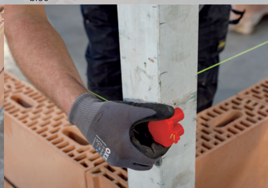
15. Appliquez le cordeau de maçon à une hauteur de \pm 2 cm sous la hauteur de la couche suivante