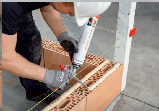
10. Appliquez Dryfix extra en 2 cordons de 3 cm de largeur, à \pm 1 cm des côtés extérieurs du bloc