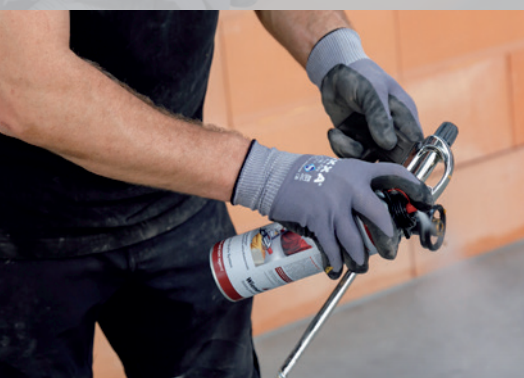
6. En cas de pauses plus longues, retirez la bombe Dryfix extra et nettoyez la tête de projection avec Dryfix cleaner