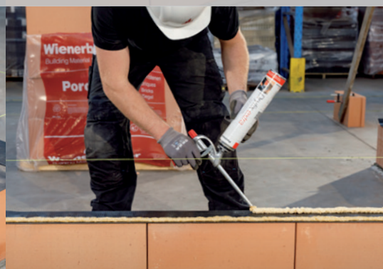
12. Appliquez 2 cordons de Dryfix extra sur la barrière anti-humidité