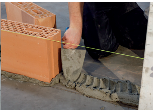
4. Maçonnez la première couche (couche d'assise)