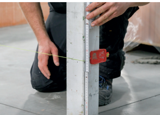
3. Placez le cordeau de maçon pour la première couche de blocs