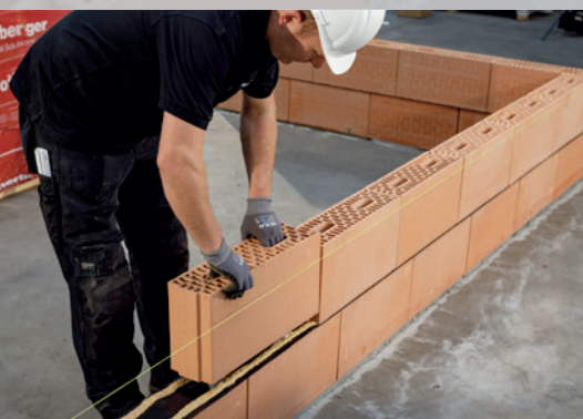
13. Posez la seconde couche de blocs