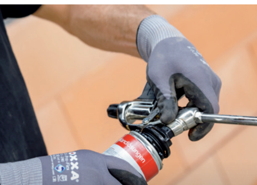
3. Vissez la bombe Dryfix extra sur la tête de projection nettoyée