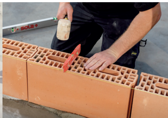
5. Contrôlez la planéité perpendiculairement au mur