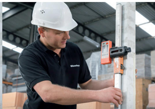
2. Mettez-les de niveau