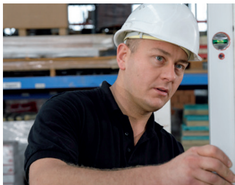
1. Installez les profilés