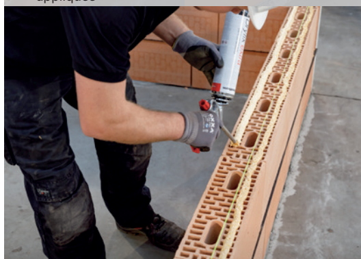
16. Appliquez Dryfix extra en 2 cordons de 3 cm de largeur, à \pm 1 cm des côtés extérieurs du bloc