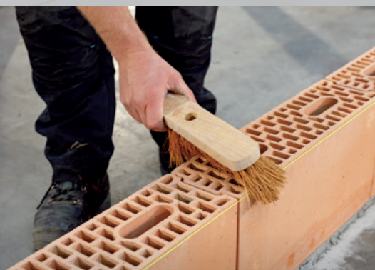
8. Brossez les blocs (répétez l'opération pour l'application de chaque couche)