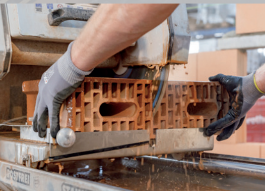
18. Découpez les blocs au moyen d'une scie à table

* Avec des murs d'un largeur de 10 cm, appliquer 1 cordon au milieu du bloc