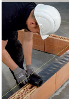
11. Placez la membrane d'étanchéité et compressez celle-ci correctement sur la mousse Dryfix extra appliquée