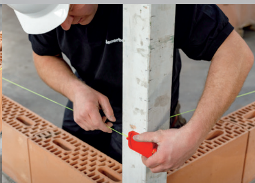
9. Appliquez le cordeau de maçon à une hauteur de \pm 2 cm sous la hauteur de la seconde couche